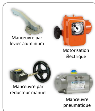
Manœuvre par levier aluminium