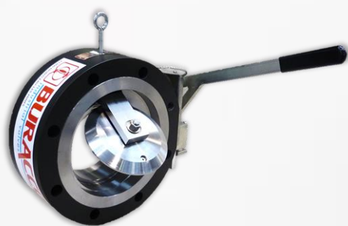
SEPARFEU-BE CLAPET D'ENTRÉE DE BAC

Nos solutions SEPARFEU pour la sécurité des BACS DE STOCKAGE :