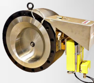
SEPARFEU-BS CLAPET DE SORTIE DE BAC